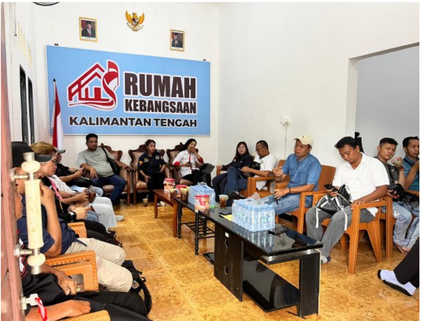
Gambar: Acara Ramah Tamah di Rumah Kebangsaan Kalteng